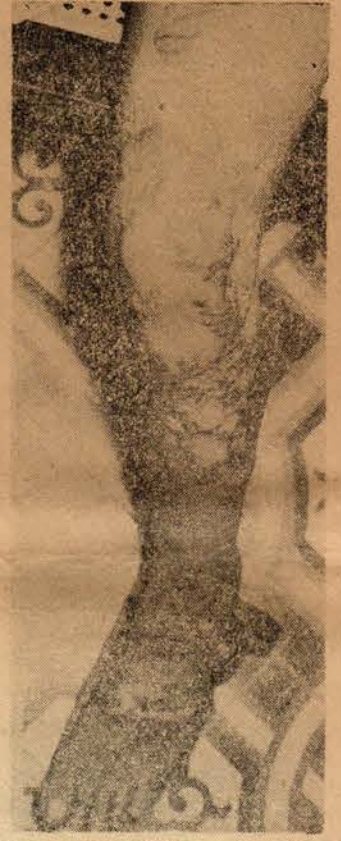
İŞTE JENOSİTİN TANIKLARI:

paralele doğru güneye indik. Yerle bir edilmiş kentler, kasabalar gördük: Phuly, Phat Diem, Ninh Binh, Nam Dinh... Hanoi'de Cia Lam, Long Bien mahalleleri yakılmış, yıkılmış... Hue sokağında enkaz altından çocuk cesetleri, kadın, ihtiyar cesetleri çıkarılırken oradaydım. Hoan Kiem hastahanesinin bombalandıktan hemen sonra halini gördüm. Mahkemenin Kopenhag'daki ikinci oturumunda üç Amerikan askeri tanıklık etti. Esirleri, tutukluları konuşurma ince sanatının uzmanlarıymışlar. Bir bir anlattılar neler yaptıklarını. Bunlar katliâm, kıyım değil mi? Köy meydanında yüzlerce mâsumu kurşunlamakla, havadan yağdırılan napalm veya bilyalı bombalarla öldürmek arasında ne fark var? Göz görmeyince gönül katlanır deyip, havadan ölüm saçanları mâzur mu göreceğiz?